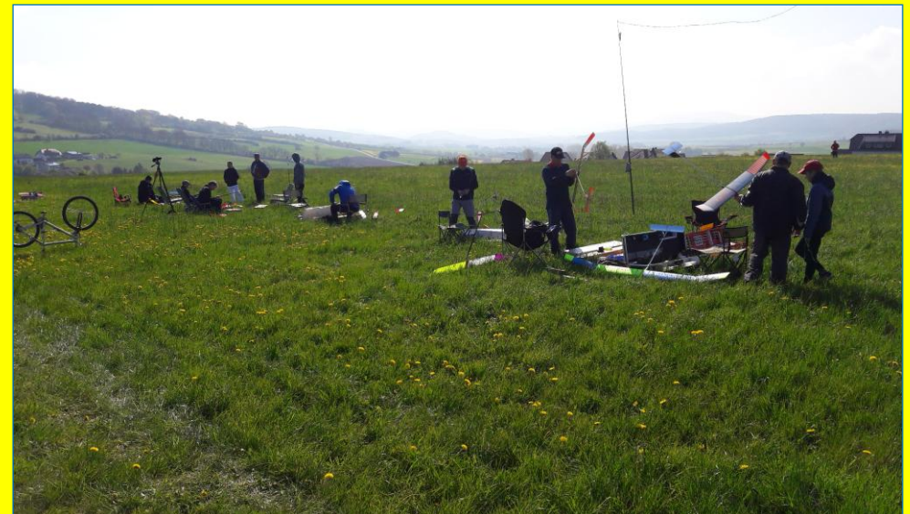
tolle Startwiese oberhalb von Ufhausen