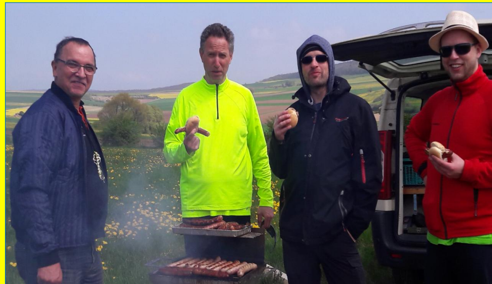
Thüringer Bratwürste vom Feinsten !